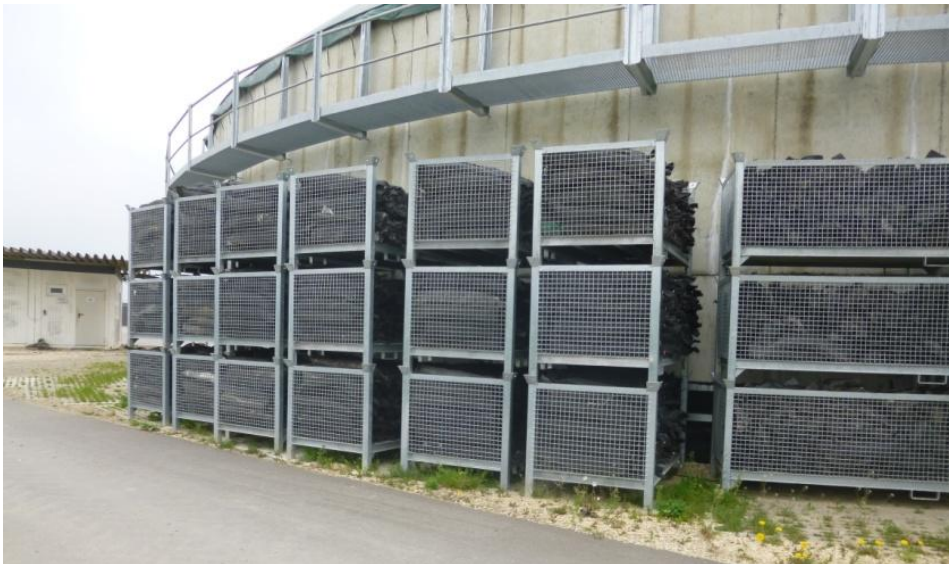
Stapelbare Lagerung der Paletten