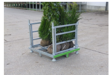
Steckbare Seitenteile optional erhältlich

Standardgröße: Länge = 1200 mm Breite = 1000 mm Steckrohrlänge = 970 mm