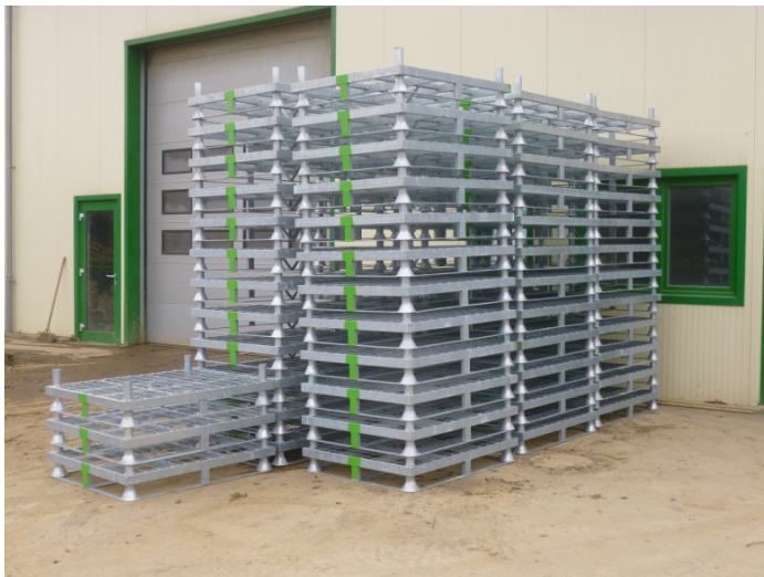
Platzsparende Lagerungen der leeren Paletten